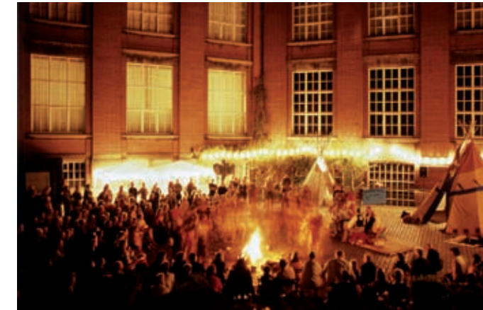
Tag der offenen Tür: Innenhof im Museum für Völkerkunde

Weihnachtliches Gospelkonzert mit Ghee Motoung & Special Guests Ghee Motoung setzt in diesem Jahr zum 18. Mal die erfolgreiche Tradition der weihnachtlichen Gospelkonzerte im Museum für Völkerkunde fort. Die Tochter der Gospel-Ikone Audrey Motoung stellt ihr eindrucksvolles Können unter Beweis – begleitet von einer eigens für das Konzert zusammengestellten Band. Freuen Sie sich auf ein wundervolles Programm mit bekannten Gospelsongs, neu arrangierten Spirituals und souligen Klängen. Ghee wird Sie auf eine unvergessliche musikalische Reise mitnehmen. In diesem Sinne: From gospel to soul let our love take control! Einlass: 19:30 Uhr | Freie Platzwahl Eintritt: 20 € | VVK ab 1. November 2011 an der Museumskasse