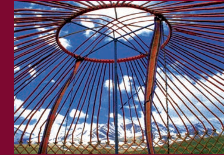
Dachkranz einer kasachischen Jurte in der Westmongolei