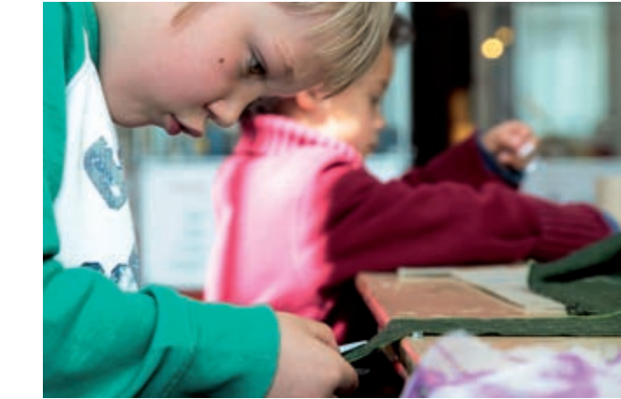
Offene Werkstatt für Kinder