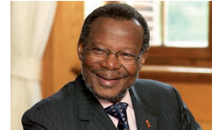
Vortrag "Forging National Unity": Mangosuthu Buthelezi