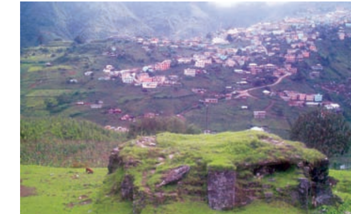
Kreuzkulte auf der Halbinsel Yukatan