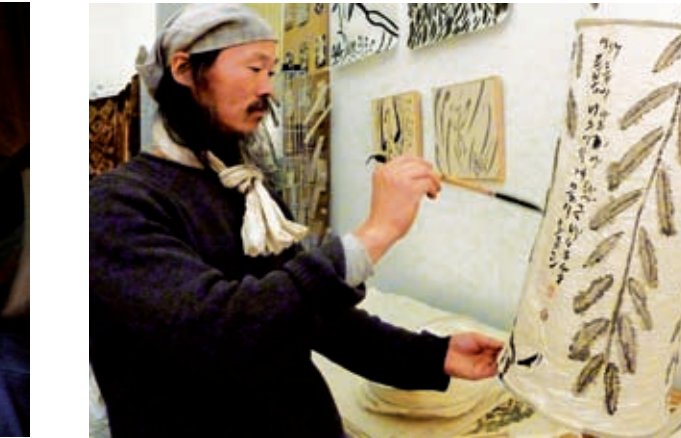
Japanische Tuschemalerei beim Markt der Völker