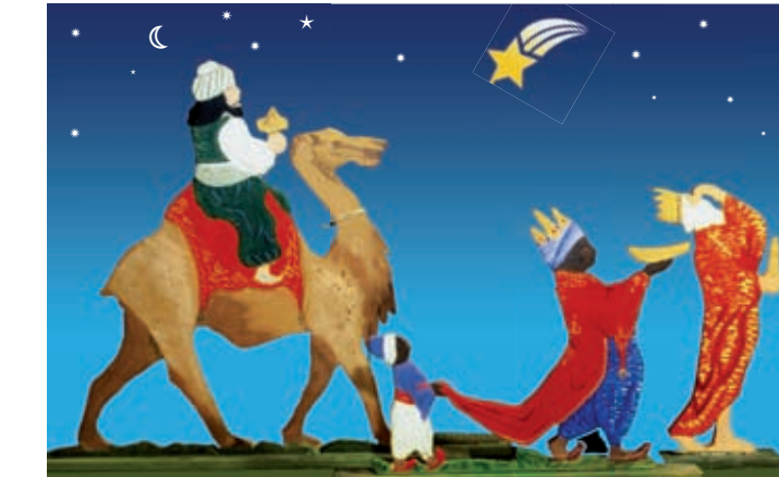
24. Norddeutscher Christkindmarkt

Ab Do 17. November 19 Uhr – 20. Mai 2012