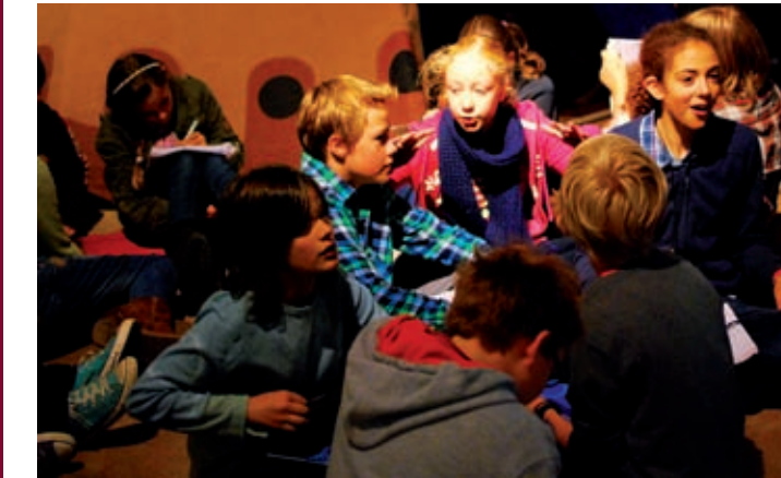
Kinder bei der Märchennacht