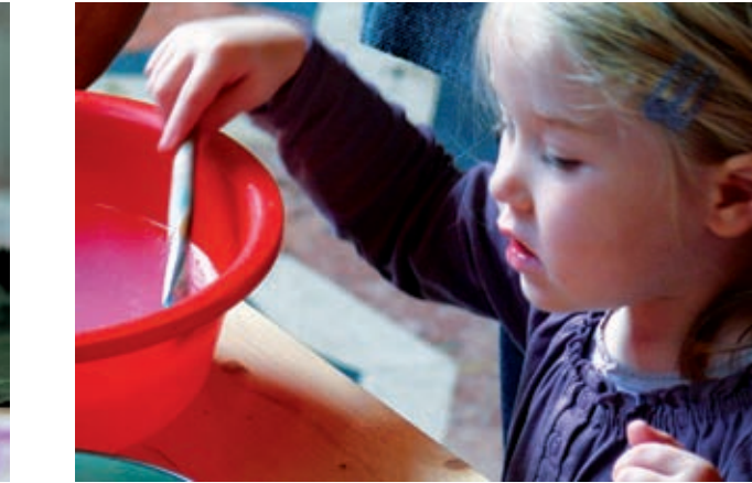
Kinder im Museum

In unserer Offenen Werkstatt können Kinder ab 8 Jahren unter Leitung erfahrener Museumspädagogen zusammen basteln und gestalten. Das Selbstgemachte kann mit nach Hause genommen werden! Ab 8 Jahre | 3 € pro Kind | keine Gruppen möglich 06.11. Lustige Tiere aus Eichen und Kastanien basteln mit Anja Nikodem 12.11.* Orientalische Lampions aus Papier und Teelichter basteln mit Katja Turé 13.11. Einen fliegenden Teppich aus T-Shirts flechten mit Ulla Weichlein 20.11. Hinduistische Bilder kennenlernen und basteln mit Anja Nikodem 27.11.* Weihnachtliche Kerzen selbst ziehen und gestalten mit Mavi Cubas 04.12. Lach doch mal! Masken der Inuit herstellen mit Katharina Steinebach 11.12. Koreanische Fächer gestalten und dabei eine alte koreanische Geschichte hören mit Ulla Weichlein 18.12. Weihnachtsmänner aus Papier falten mit Anja Nikodem * Sonderwerkstätten im Rahmen der Märkte mit extra langen Öffnungszeiten