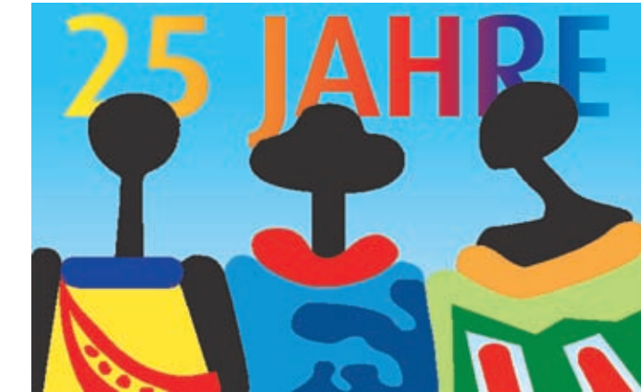
25 Jahre Markt der Völker