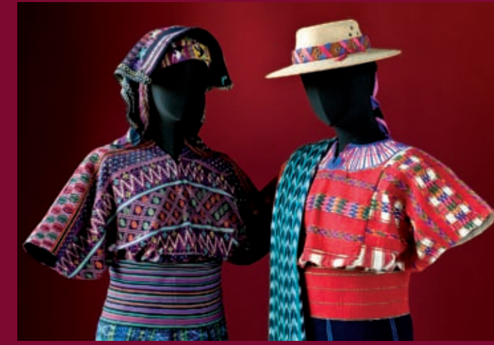
„Elmenhorst &amp; Co.“ Hamburger Sammlungen von Mayatextilien